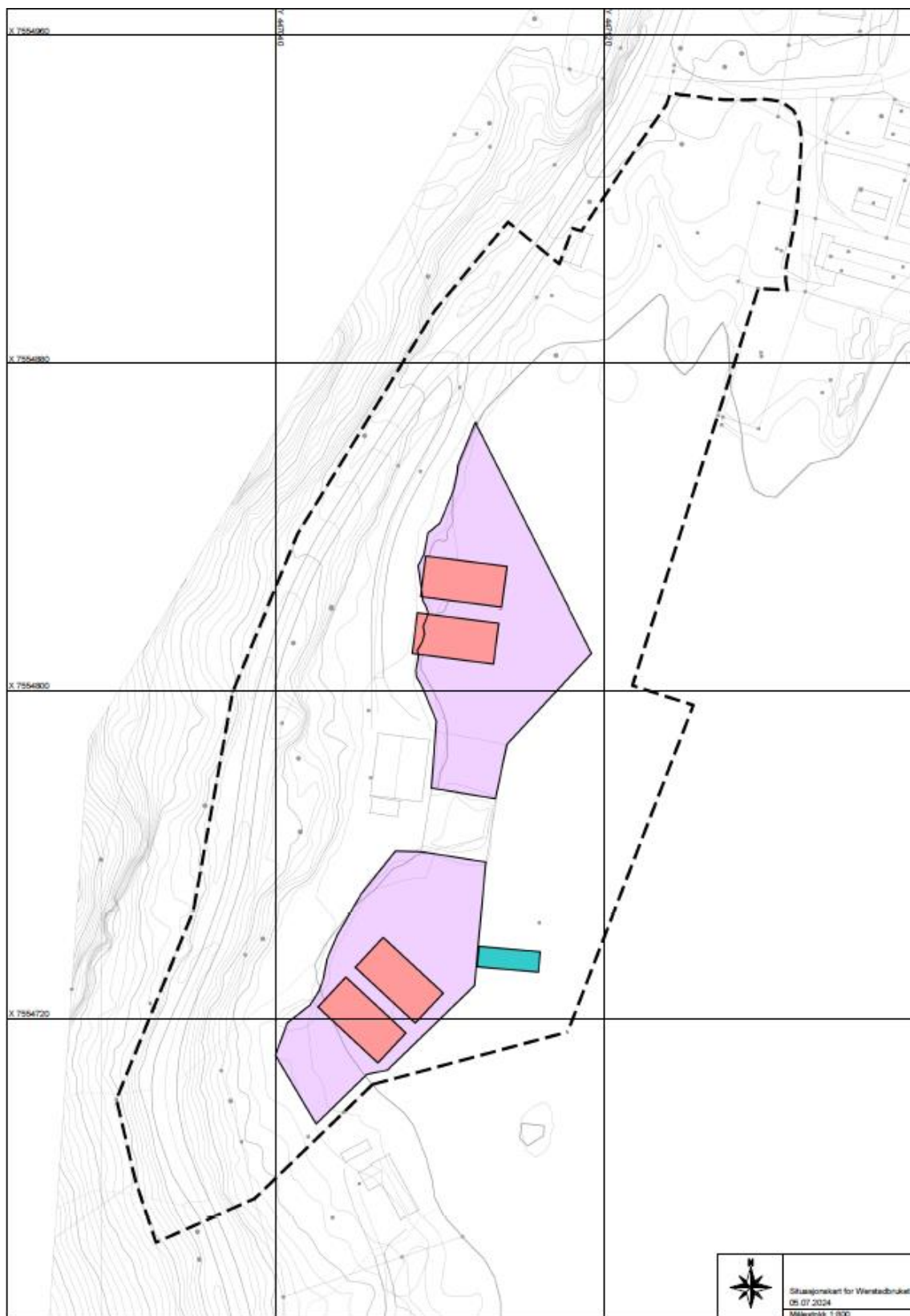
Figur 2: Planavgrensning vist med sort stiplet linje, utfylling/ oppfylling vist med rosa farge, lagerbygg vist med rød farge, flytebrygge vist med blå farge.

b. Tiltak som planen skal tilrettelegge for