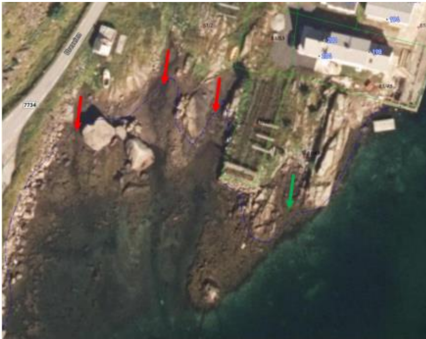
Figur 3: Sjøsettingssteder for kajakk (Planbeskrivelsen til reguleringsplan for Leirvik, Ure).

I referatet fra oppstartsmøte ser vi at det uttrykkes bekymring i forhold til at tiltak i planarbeidet kan ødelegge for sjøsetting for kajaker. Den vedtatte planen for Leirvik, Ure vil bygge ned et område i fjæra som benyttes til sjøsetting av kajaker (se grønn pil i figur nedenfor). I planbeskrivelsen til denne planen vises til alternative området for sjøsetting i umiddelbar nærhet (vist med røde piler i figur nedenfor).