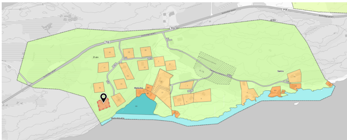
Figur: gjeldende reguleringsplan for området

Den sist vedtatte reguleringsendringen er dokumentert via planbeskrivelse, plankart, planbestemmelser og ROS-analyse.