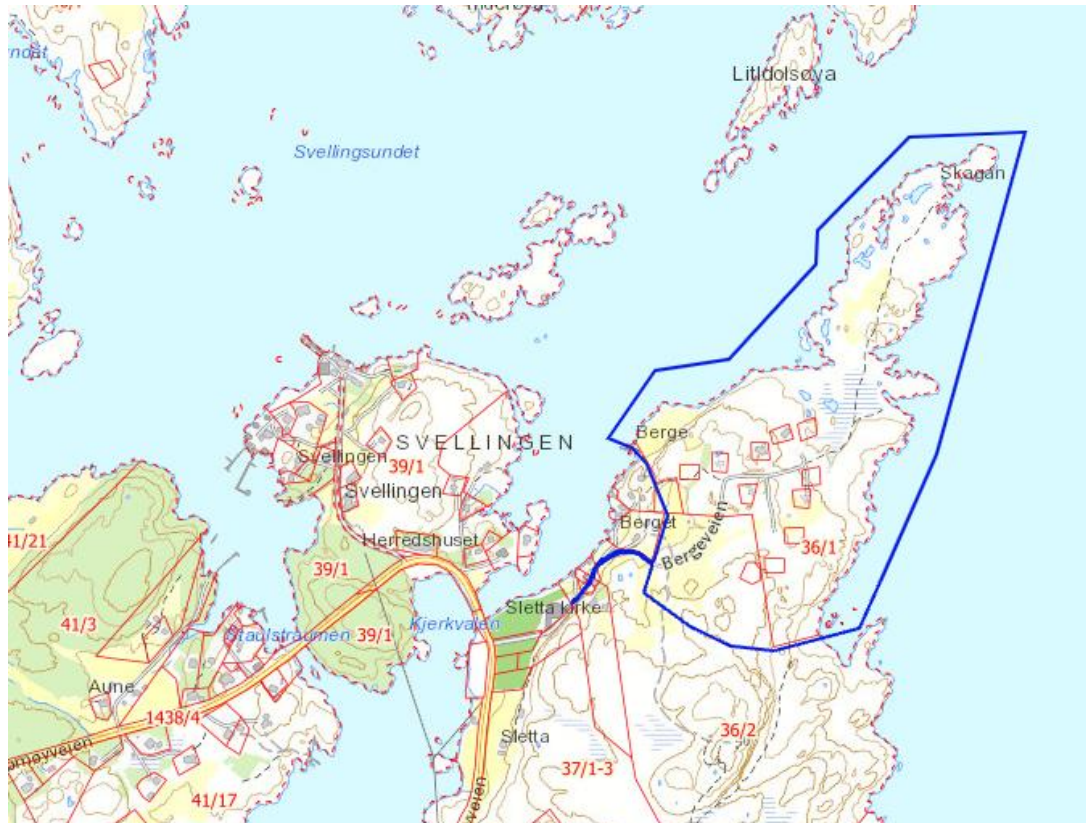
Figur 1 viser planområdet

Kystplan AS er engasjert av Skagan AS for å utarbeide endring av reguleringsplan for gnr 36 bnr 1 m.fl.