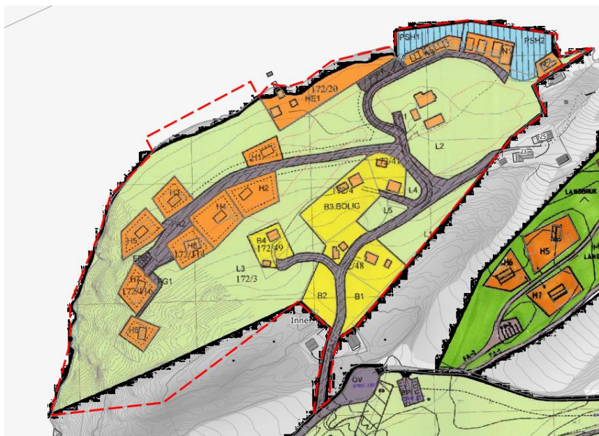
Figur 2. Bildet viser gjeldende plan. Ny plangrense vist med rød, stipla linje

Gjeldende reguleringsplan dekker ca 205 daa. Ny plan omfatter hele den gjeldende planen samt en utvidelse i sørvest, og en utvidelse i sjøen der det er tenkt et nytt naustområde. Se bildet under.