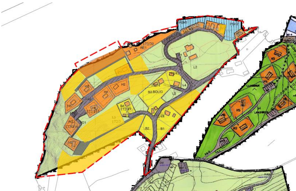
Figur 4. Eksisterende reguleringsplan. Områder som ønskes endret vist med gjennomslittige, fylte flater

Planområdet ligger i vest og nordvest helling mot Nordfjorden. Det aller meste av den gjeldende reguleringsplanen er gjennomført ved at det er bygd internveier og hytter i området. Naustområdet ved sjøen er etablert.