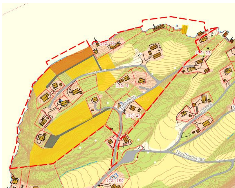
Figur 5. Plangrense og endringer vist i grunnkartet

Terrenget i området er småkupert. Det består delvis av grunnlent utmark, og det er to teiger registrert som jordbruksareal nordøst i området.