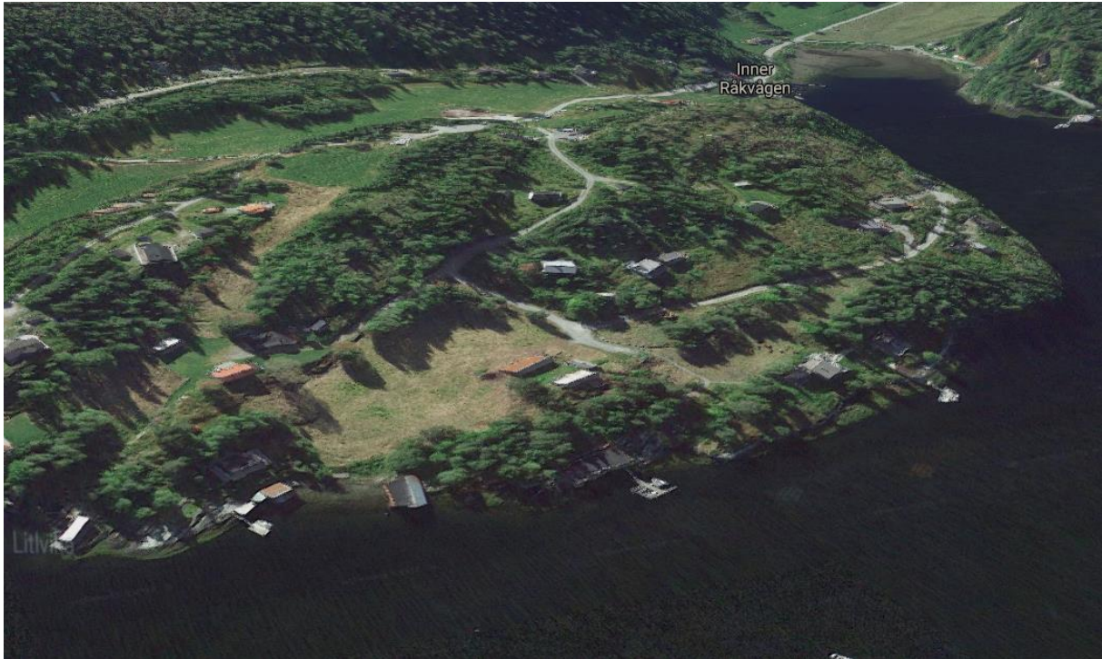
Figur 3. Bilde av planområdet