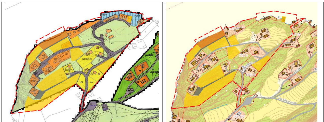
Figur 5. Eksisterende reguleringsplan til venstre og grunnkart til høyre. Områder som endres vist med gjennomsliktige, fylte flater