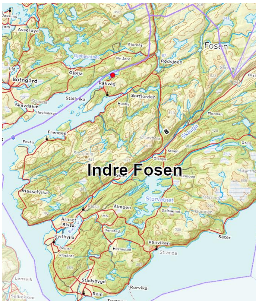
Figur 1. Oversiktskart

Planområdet ligger i Nordfjorden som er den nordlige arma av Stjørnfjorden. Råkvåg ligger også ved Nordfjorden, ca 3 km fra planområdet. I Råkvåg er det barnehage, omsorgsboliger, kafeer, restauranter og flere tilbud til turister, hyttefolk og fastboende. Småvikern ligger i et område med mye hytter, både i felt og frittliggende. Ellers er det noe spredt bosetting og noe gårdsdrift i området. Grunnskolen ligger i Sørfjorden, innerst i den sørlige arma av Stjørnfjorden.