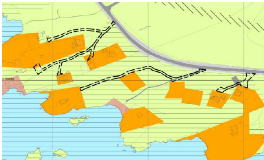
Planavgrensningen og dagens situasjon